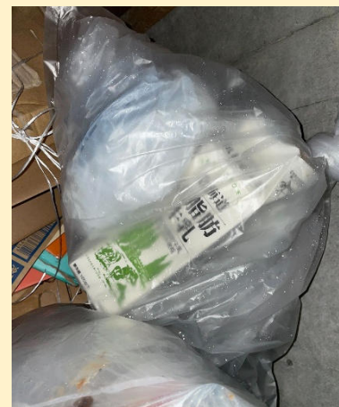
札幌工場様女性宿舎の分別間違い。回収後、再度分別を指示。