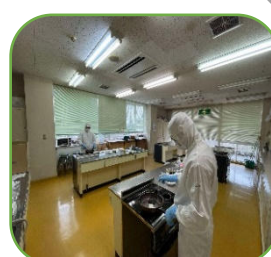
MN 群馬工場様: 公民館で技能実習の専門級練習の風景