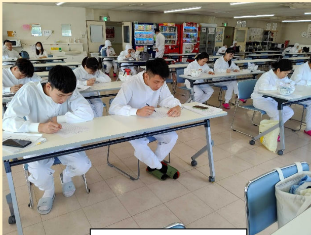
技能評価試験練習(MN九州)