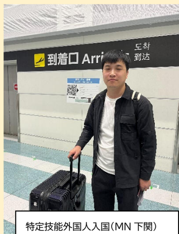
特定技能外国人入国(MN下関)