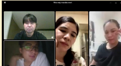
森工場様オンライン面談の様子。一時帰国直後だが、変わらず元気な様子を見せていた。