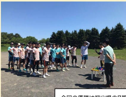
今回の優勝は初出場の7期生チーム！昨年好評だったことを受け、今年は豪勢にメダルやトロフィーも準備。