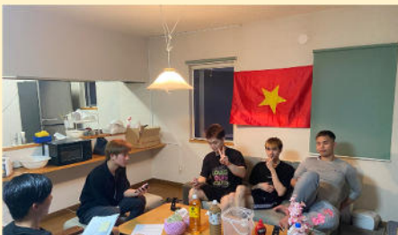
名寄工場様宿舎巡回の様子。メロンの差し入れを行い、その場で切り分けて食べていた。