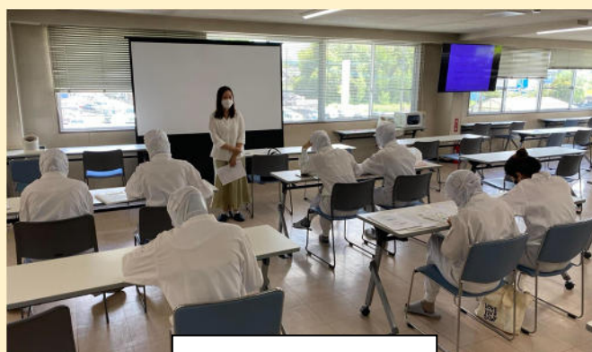
技能評価試験練習(MN九州)