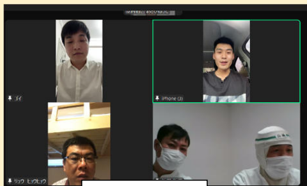
特定技能面接(MN下関)