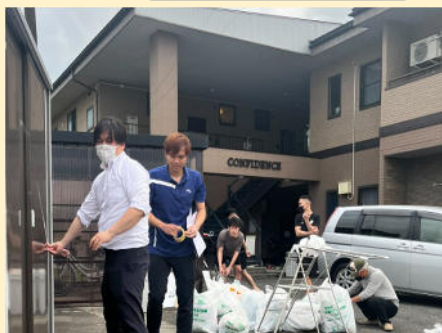
MN大江様 GW 休み前の宿舍大掃除を実施した。