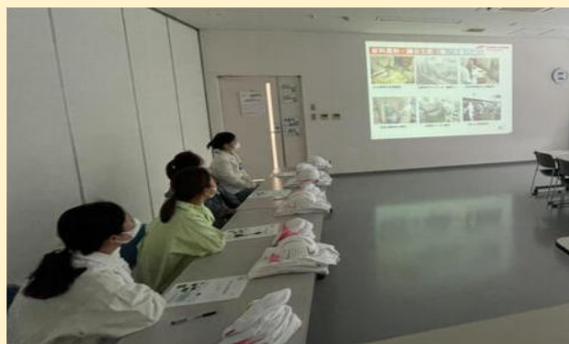
MN 大江様 中国特定技能4名の入社オリエン時の様子